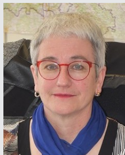
Isabelle NOTTER Directrice régionale de l'économie, des entreprises, du travail et de la solidarité

Tous les acteurs concernés ont à nouveau répondu présent pour participer aux groupes de travail qui vont maintenant écrire les fiches actions du PRST 4 : qu'ils en soient remerciés car c'est le gage de la qualité des travaux que nous allons mener.